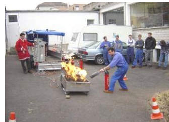
... mit dem Feuersimulator ...

Im Praxisteil unseres Brandschutzkurses kann dank dem mobilen, vielseitigen Feuersimulator der Ernstfall umweltfreundlich beim Kunden vor Ort geübt werden, ohne Menschen zu gefährden und ohne Brandrückstände zu hinterlassen. Jeder Teilnehmer lernt die Handhabung der heutzutage wichtigsten Löschgeräte.